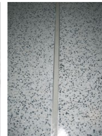
Elaborazione di un giunto di dilatazione