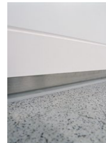
Pavimento alla veneziana montato in pendenza