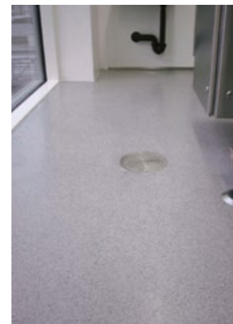
Sigillatura e intervento sullo scarico igienico